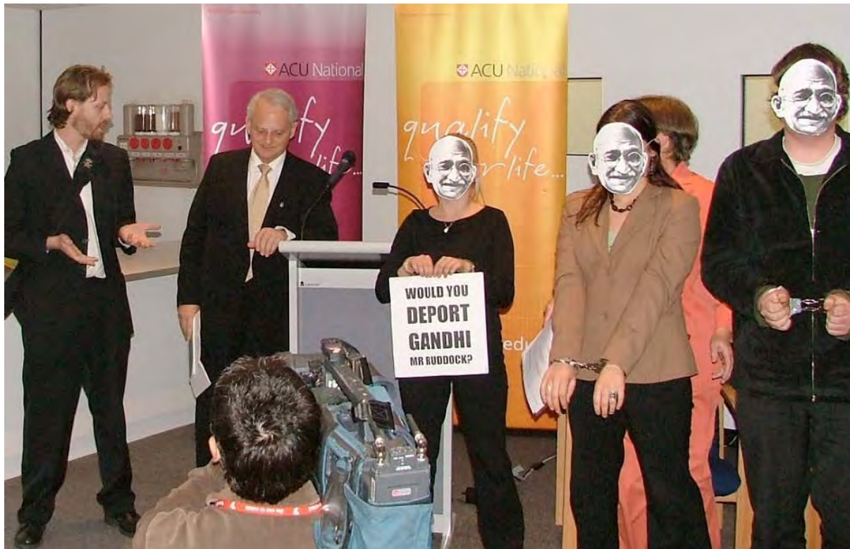
Una protesta contro la deportazione di Scott Parkin dall'Australia

Consulta il sito http://www.bmartin.cc/pubs/backfire.html (o cerca “Brian Martin backfire” sui motori di ricerca) per reperire le analisi delle tattiche usate in alcune lotte contro la censura, la diffamazione, le molestie sessuali, la deportazione di Scott Parkin, le aggressioni della polizia, le stragi di manifestanti pacifici, le torture, il genocidio e altre ingiustizie.